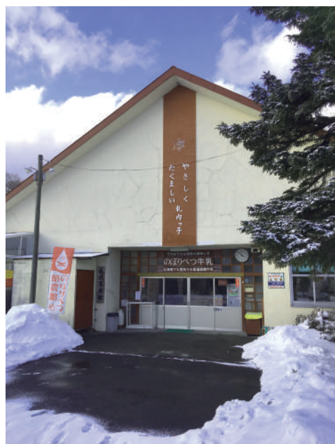
廃校を利用した「のぼりべつ酪農館」