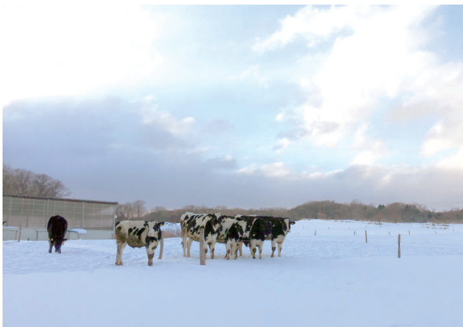
のぼりべつ酪農館の牛乳は、登別・室蘭地区の酪農家が生産したこだわりのもの

のぼりべつ酪農館は、おいしい牛乳、おいしいチーズを作るために、牛の餌を栽培する土から考えています。株主はすべて地元(登別・室蘭地区)の酪農家で、理想を同じくする酪農家による企業です。だからこそできる、こだわりの牛乳、ホエイ生産です。