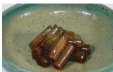
行者にんにくの醤油漬け

行者にんにくは北海道に自生する山野草で、地元ではアイヌネギ、キトピロとも呼ばれ、山菜採りの対象植物として有名です。ユリ科ネギ属で独特のにんにく臭があり、おひたし、しょうゆ漬け、炒め物などに利用される他、ウインナーなど加工食品の味付けにも使われています。アイヌ民族も古くから食用としており、キトウシ(アイヌ語で行者にんにくの群生する所の意)など行者にんにくにちなんだ地名も残っています。